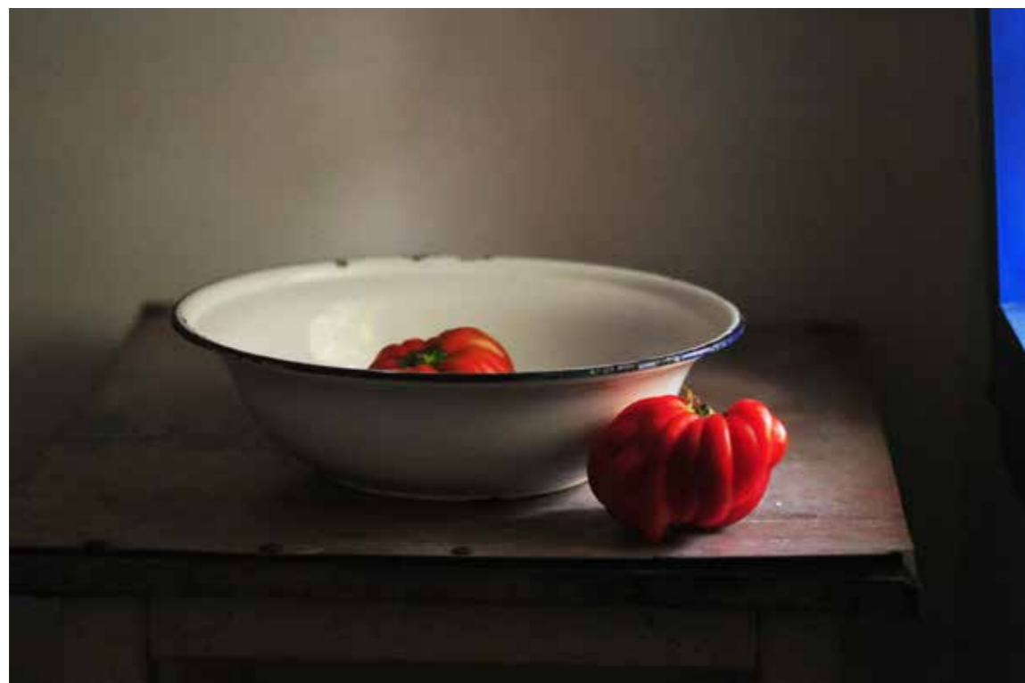
חלון כחול, 2016