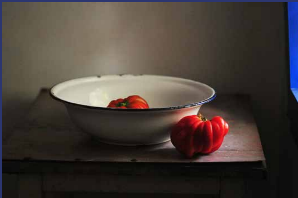
OSNAT BEN DOV BLUE WINDOW